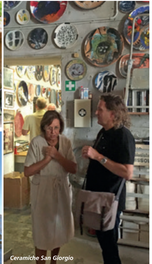
Ceramiche San Giorgio

kunstners italienske hjem – med flere bygninger, hvor han havde bolig, atelier m.v.