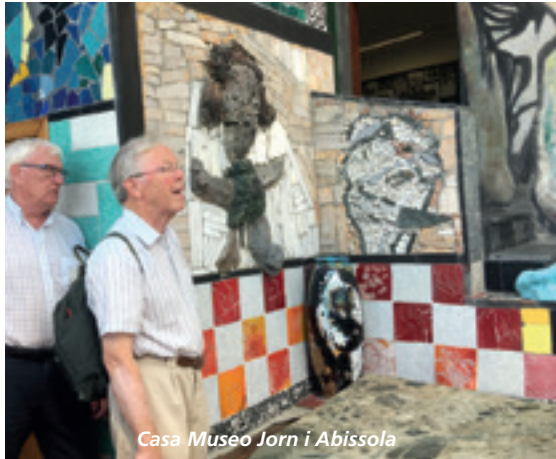
Casa Museo Jorn i Albissola